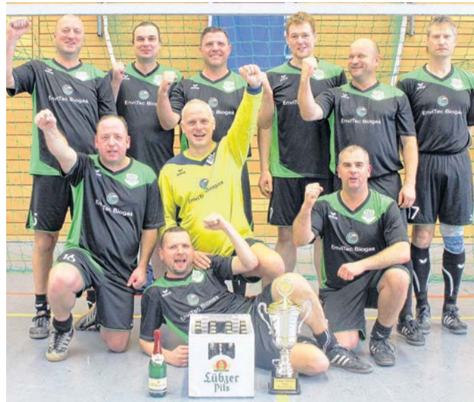
So sehen Sieger aus: Die Oldies des TSV Friedland 1814 feierten ihren Erfolg.

Endstand: 1. TSV Friedland 15 Punkte/19:9 Tore; 2. TSG Neustrelitz I 12/24:5; 3. SG Groß Quassow 7/14:13; 4. SV Union Wesenberg 4/9:19; 5. TSG Neustrelitz II 3/7:18; 6. FSV 90 Altentreptow 2/9:18.